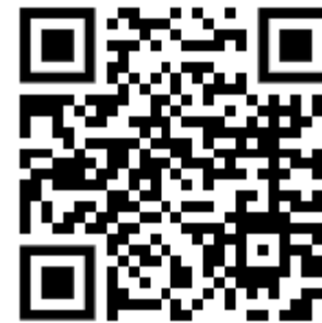
คิวอาร์โค้ด (๔)

คิวอาร์โค้ดแบบพกพา แบบ รร.๑, ๒, ๓, ๔; แบบ รร.๑, ๒, ๓, ๔