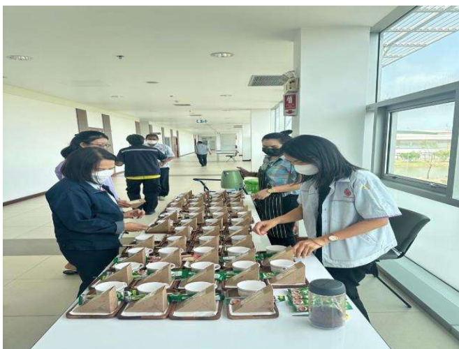
จัดประชุมที่เป็นมิตรต่อสิ่งแวดล้อม